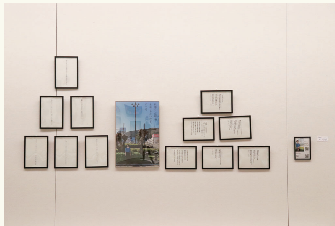
準グランプリ ミスマアヤカ (写真 / 詩 / 短歌)