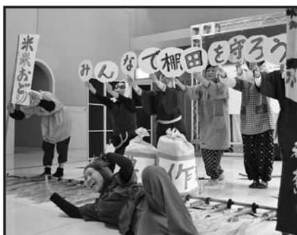
上勝シスターズ こめこめ踊り

[受賞理由] 棚田の米作りの一年間を大変うまく構成していた。ラストまでパフォーマンスのテンションを維持できており、飽きさせなかった。出演者たちが心底たのしそうに演じていたことで、場をなごませてくれた。