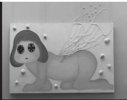
誕生 2013年 ペニヤ板にアクリル