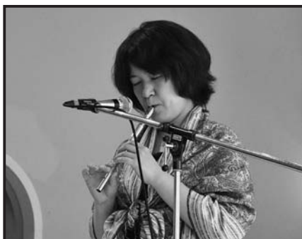
白圭 組曲「惑星」木星より他