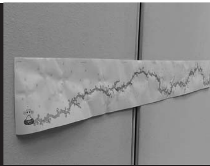
迷走の街 2012年 紙、ペン、その他

[受賞理由] 5メートルの幅をうまく使って自分に適した表現を行っていたことを評価した。