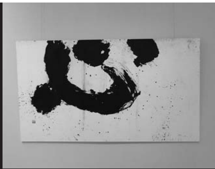
heart 2012年 書道

[受賞理由] 初挑戦の不安を感じながらも、前向きに大作に挑む心情が伝わる表現であることを評価した。