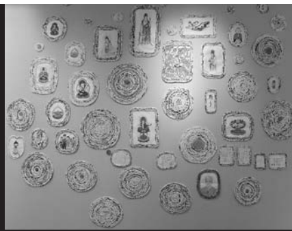
パワースポット 2012年 紙、絵画、造形