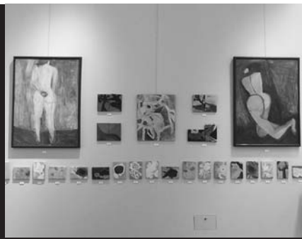
びっくり箱 2012年 油彩、Canvas.