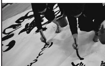
四国大学 書道クラブ