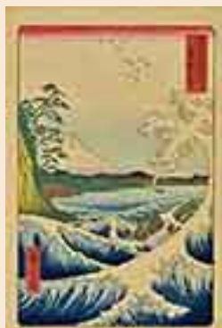
歌川広重<富士三十六景 駿河蓬夕之海上> 1858年4月 中外産業株式会社原安三郎 コレクション蔵