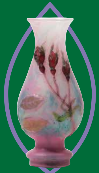
《花器(バラ)》1901年頃 大一美術館蔵