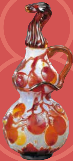
《蓋付瓶(ブドウ)》1900-02年頃 ポーラ美術館蔵