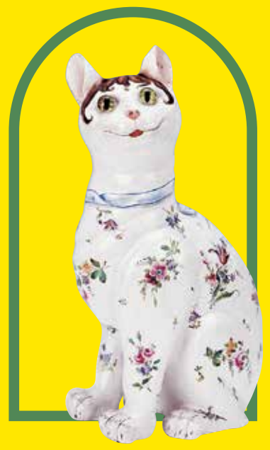
《猫型置物》1865-90年代 松江北堀美術館蔵