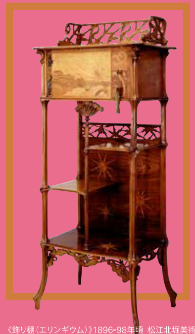
《飾り棚(エリンギウム)》1896-98年頃 松江北堀美術館蔵