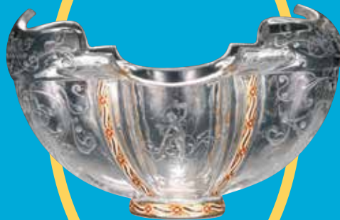
《花器(ニンフ、唐草)》1880-86年頃 個人蔵