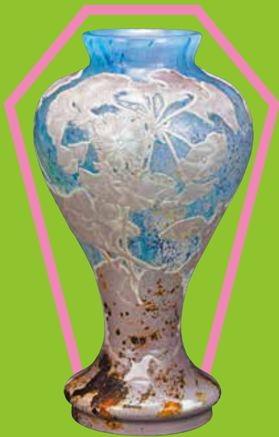
《花器(プリムラ)》1900年頃 個人蔵