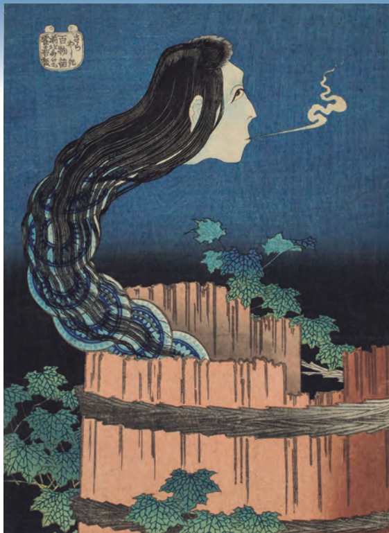
「一枚、二枚…」お皿が首に?北斎の奇想きらめく逸品 | 1

徳島ゆかりの人物が長年にわたり築き上げた豊かなコレクションを、ここ徳島でぜひご堪能ください。