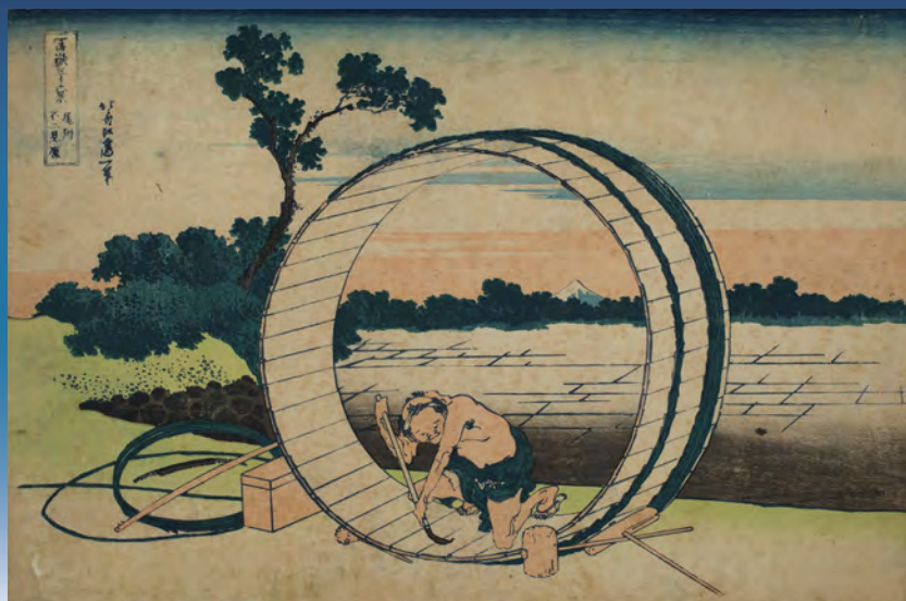
巨大な桶から小さな富士山を臨む、驚きの構図 | 2

徳島城博物館でも、原コレクションを特別公開 夏の企画展「公文蘆淵」(2026年7月25日[土]-10月4日[日])を開催 原コレクション(更級日記絵巻)は、9月23日[水・祝]まで展示 ※詳しくは、徳島市立徳島城博物館HPをご確認ください。