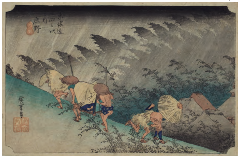
風雨の音から人々の息づかいまで、広重が描き出す臨場感 | 4