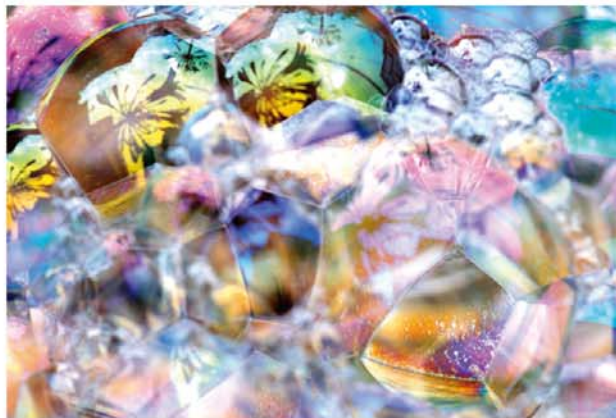
1ミクロン(アガパンサス) / 1micron (agapanthus) 2008

徳島県立近代美術館の企画により、フレアとくしまで開催される、このたびの展覧会では、秋元の代表作であるシャボンやゼリーを主題にした近作の展示をご覧ください。新作の映像作品「ひとつのそら」の初めての上映を予定しています。作品と関りの深い材料であるゼリーを用いたワークショップや学芸員によるレクチャーも予定しています。