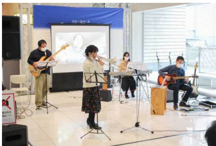
「パフォーマンス部門」グランプリ たけと愉快的な仲間たち