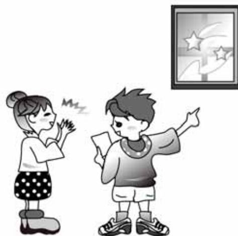
[会場のパネルから]