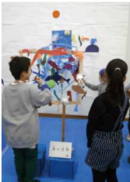
昨年の活動のようす