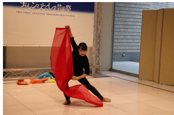
2 前回 パフォーマンス部門 2019 グランプリ 匿名 A