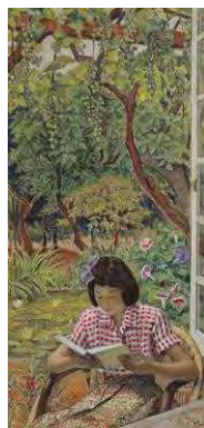
④河井清一 〈夏の朝〉 1959年