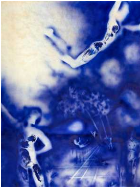
①イヴ・クライン 〈空気の建築 ; ANT 119〉 1961年

展覧会の広報用として次の作品の画像データを提供できます。使用にあたっては、「作家名」、「作品名」、当館蔵であることを明示してください。