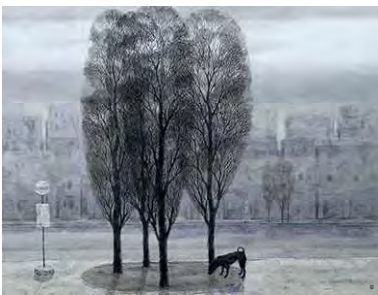
③市原義之 〈街の朝〉 1971年