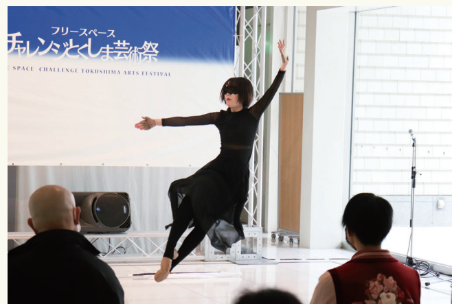
準グランプリ 匿名 A (カラーガード)