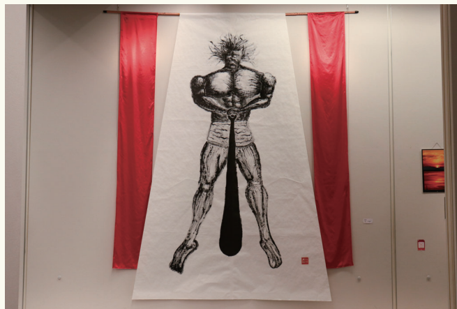
グランプリ melon (絵画)