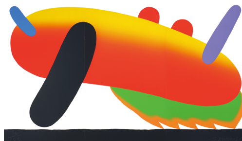
元永定正〈あいにしゅたいん〉1986年 当館蔵